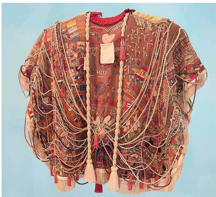
O Manto da Apresentação de Arthur Bispo do Rosário