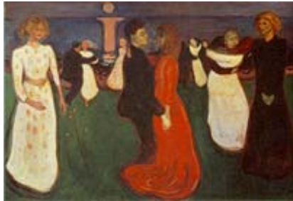
Imagem: Edvard Munch A Dança da Vida 1899-1900.